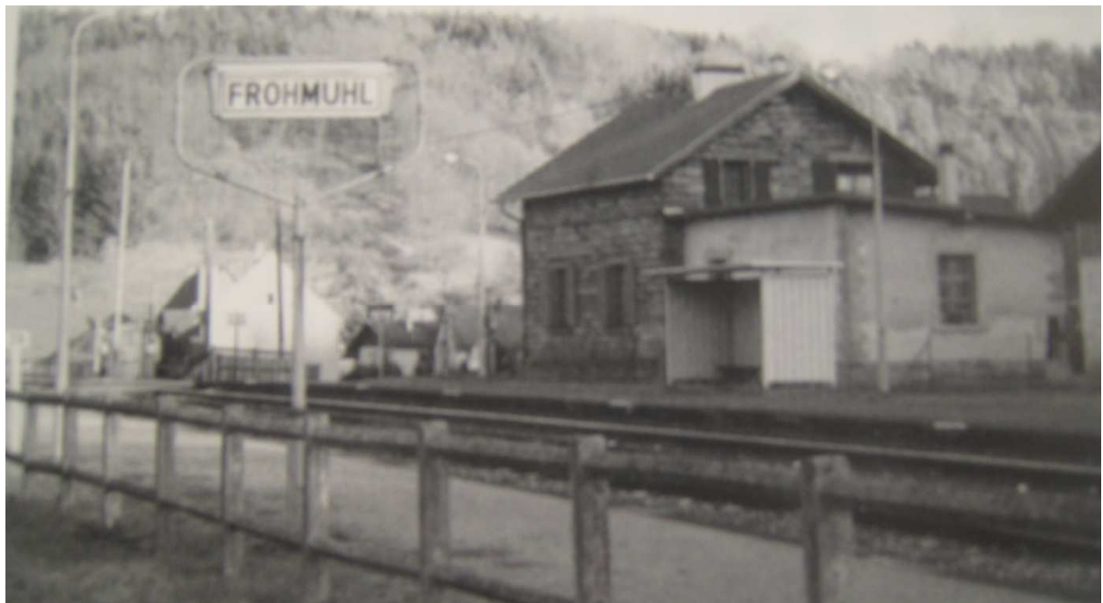
La gare de Frohmuhl à l'époque de sa fermeture

La circulation des trains sur cette ligne était très importante. En premier lieu, elle servait au transport de matériaux lourds tels que charbon, minerai de fer, grumes, pierres de taille... Elle était également utilisée à des fins stratégiques militaires. Bien sûr, elle servait aussi pour le transport des voyageurs.