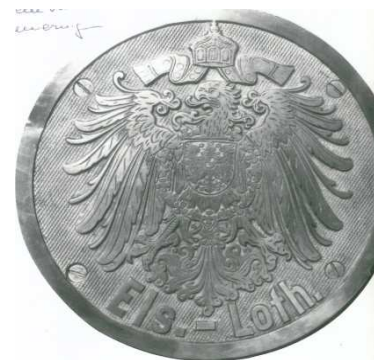
Plaqué de locomotive Alsace Lorraine

Cette ligne a été inaugurée le 1 er mai 1895 et le trafic se faisait sur une seule voie jusqu'en 1897, date à laquelle la 2 e voie était fonctionnelle.