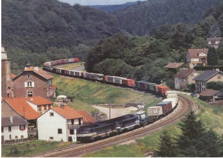
Au temps où les trains de marchandises circulaient régulièrement sur la ligne Strasbourg-Sarreguemines.