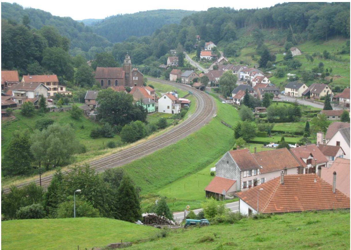
Vue du village divisé en deux par la voie ferrée

Le chemin de fer traverse le village et coupe celui-ci en 2 parties. Ce fut un bouleversement du paysage mais ô combien bénéfique pour la région, le village et sa population. La voie de communication vers Strasbourg et Sarreguemines a servi et sert toujours comme moyen de transport et de liaison pour rejoindre un lieu de travail ou d'autres destinations.