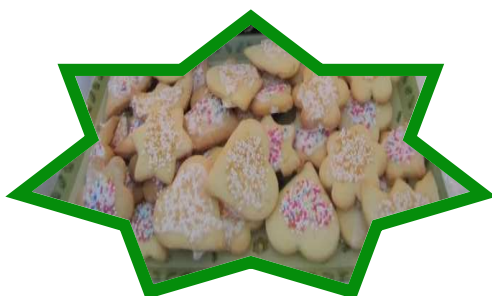
Bredele de différentes formes

Avant Noël on s'activait beaucoup dans tous les foyers du village : c'était le moment de faire les petits gâteaux de Noël : les Bredele . On faisait surtout les « Spritzbredele ». Le boulanger faisait les petits gâteaux à l'anis.