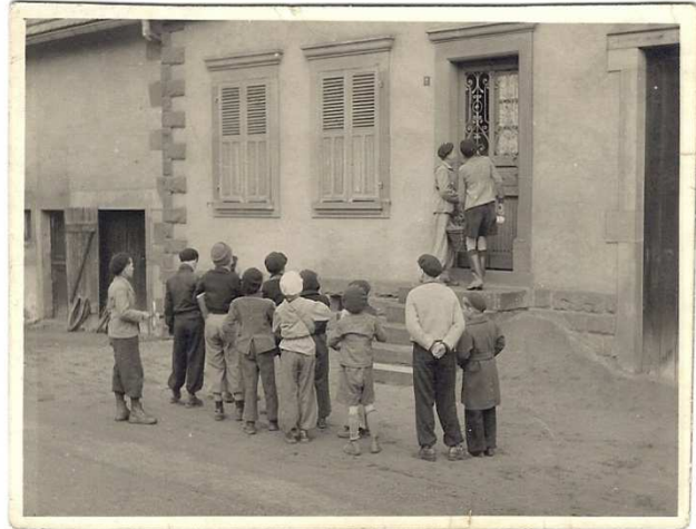
Les servants de messe au cours de leur collecte le samedi saint