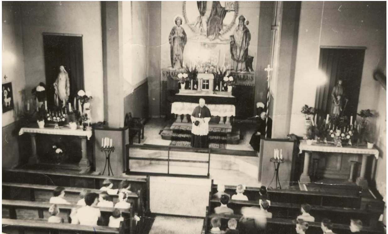
Vue de l'intérieur de l'église avant les transformations La fresque derrière l'autel représente le Christ au centre, Ste Madeleine à gauche et St Gall à droite

avoir créé plusieurs monastères, il est parti en Allemagne puis en Suisse où il mourut le 16 octobre 646.