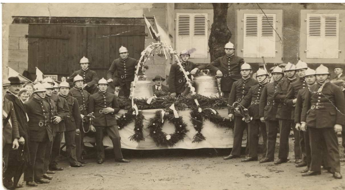
Les cloches parées et décorées sur une charrette devant l'ancien restaurant Doerflinger

Le 29 janvier 1933 a eu lieu la bénédiction des cloches.